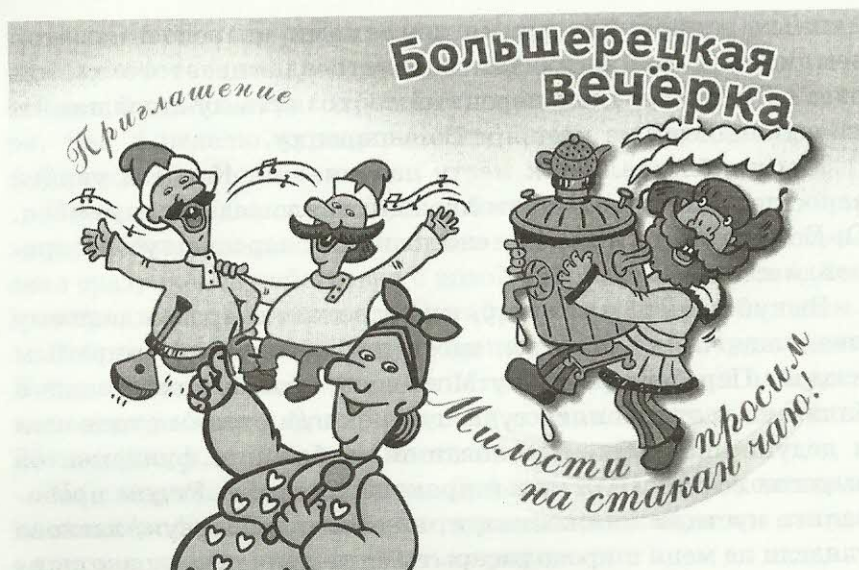
Приглашение на «Большерецкую вечерку» по случаю 300-летия камчатских родов Логиновых, Селивановых, Коллеговых, 21 января 2012 года