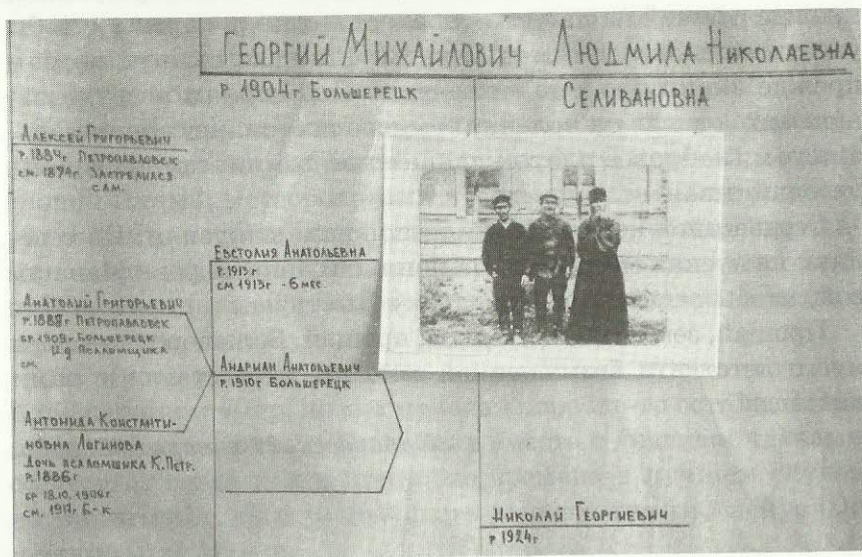
Фрагмент родословного древа большерецких родов, составленный специалистом госархива Камчатского края Е. П. Абрамовой